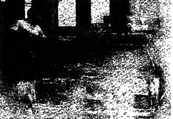
انفجار الحريق في سيارة اشعلت نشبته انفجار ثمة الخياط (رويتز)

انفجرت عند الساعة السادسة الا ربعا من صباح عيد السيرة... اشعلت نشبته انفجار ثمة الخياط (رويتز)